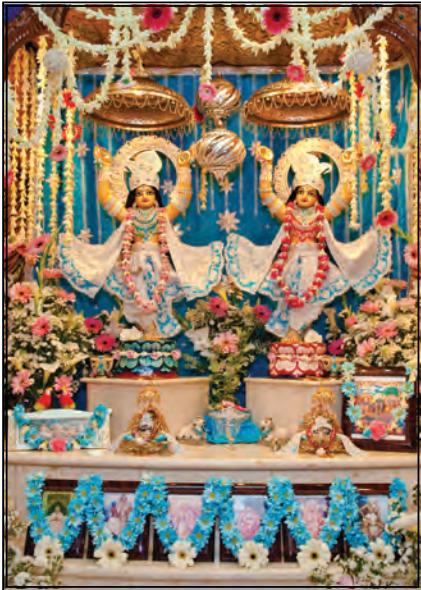
Parama Karuṇa Śrī Śrī Nitāi Gaurachandra Giri Govardhan Caracas - Venezuela