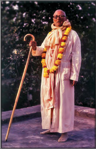
Om Viṣṇupāda Śrī Śrīla Bhakti Rakṣak Śrīdhar Dev-Goswāmī Mahārāj