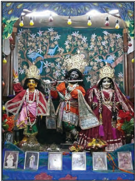
Śrī Śrī Guru-Gaurāṅga-Gāndharvā-Govindasundarjiu Nabadwīp - India