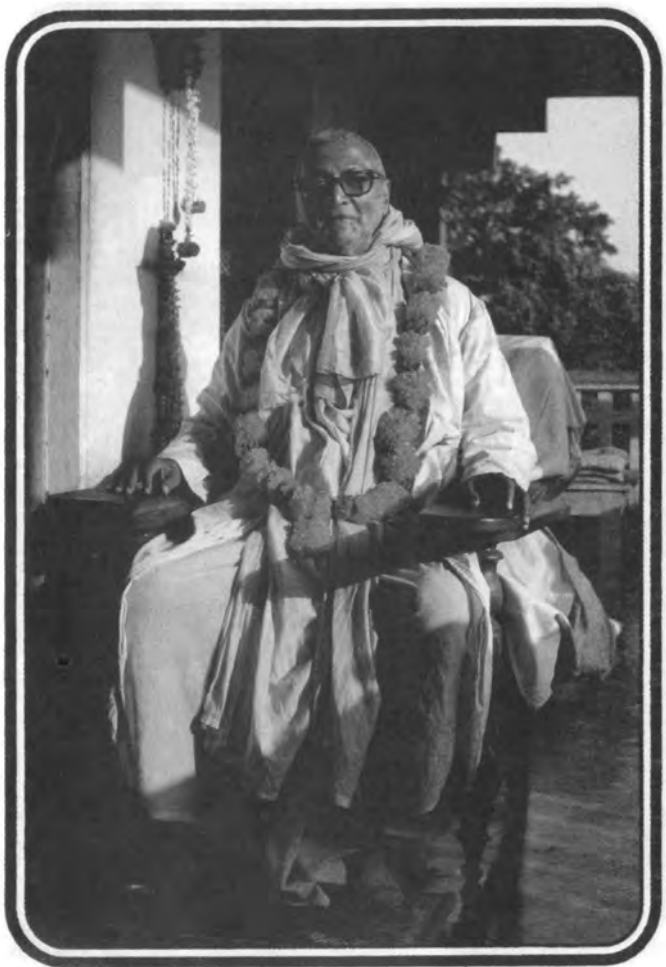
Om Visnupad Sri Srila Bhakti Raksak Sridhar Dev-Goswami Maharaj