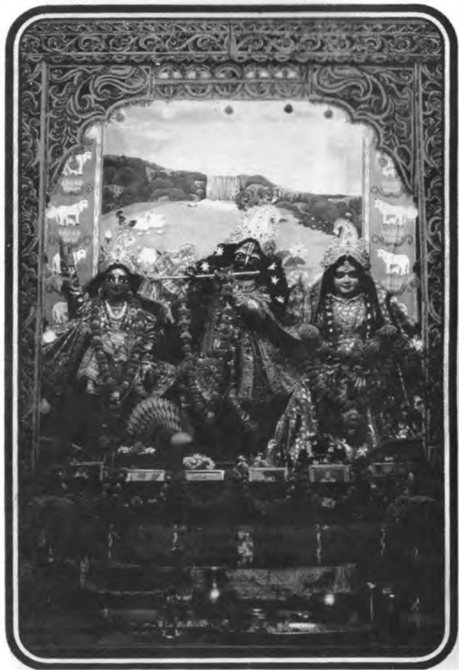
Sri Sri Guru-Gauranga-Gandharva-Govindasundarjiu