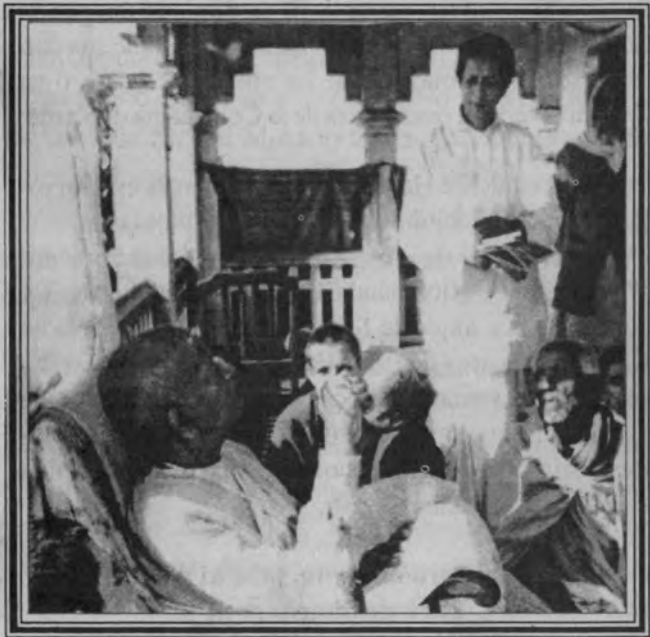
Om Visnupada Srila Bhakti Sundar Govinda Dev Goswami Maharaj y Om Visnupada Srila Bhaktivedanta Swami Maharaj en e! Sri Chaitanya Saraswat Math ( Sri Nabadwip Dham.)