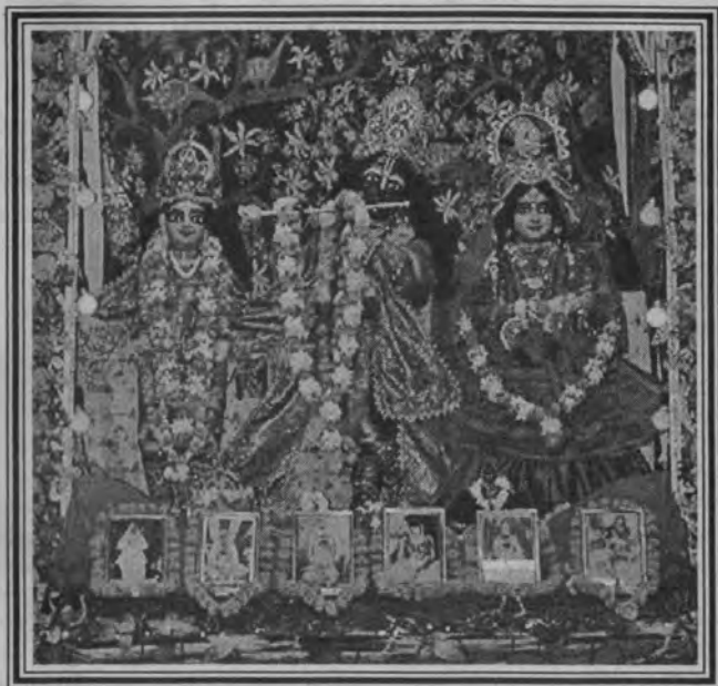
Sus Señorias Sri Sri Guru-Gouranga Gandharva-Govinda Sundarjiu ( Nabadwip Dham )