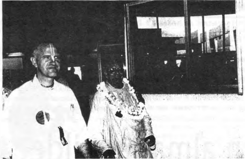
Su Divina Gracia al llegar al aeropuerto de Tijuana, el 14 de junio de 1997. Aquí lo acompaña Sripad B. K. Ashram Maharaja.

“Tú eres tu mejor amigo o tu peor enemigo”. Hazte tu mejor amigo, no tu peor enemigo”. Este es el consejo de Krishna. Krishna ha dado todo el conocimiento en el Bhagavad-gita . Cuando habló siento que Él dio miles de