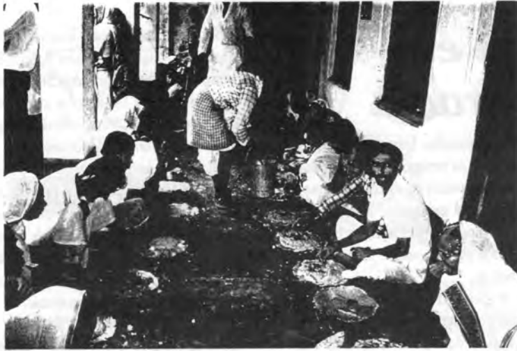
Misericordiosa distribución de Prasadam en los Maths de la misión en India.