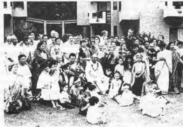
Su Divina Gracia y los devotos en la Convención de Morelia.