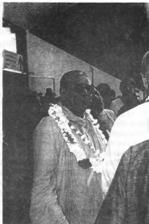
Su Divina Gracia , llegando al aeropuerto de Tijuana el 14 de junio de 1997.

También se ha redoblado el ánimo de los devotos locales para salir los fines de semana a distribuir literatura lo cual seguramente les dará las bendiciones de Sri Gurudeva y una nueva perspectiva de la conciencia de Krishna.