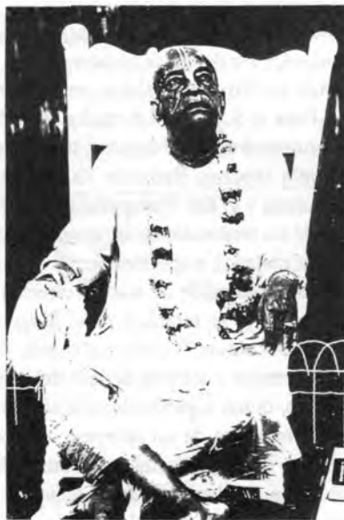
Srila A.C. Bhaktivedanta Swami Prabhupada