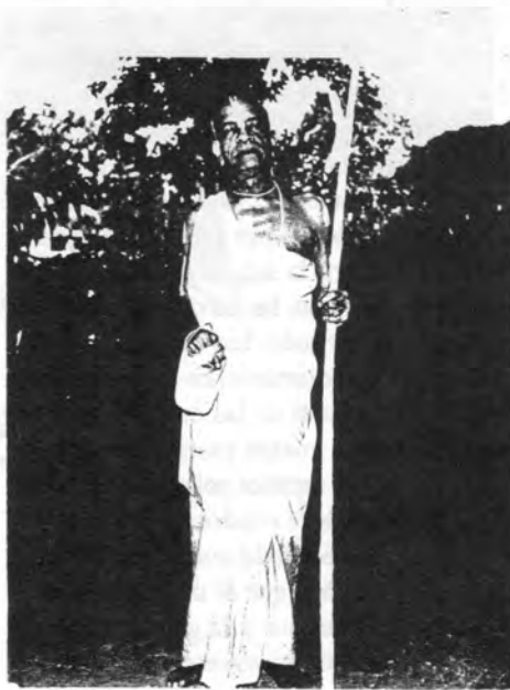
Srila Prabhupada , distribuidor pródigo de la misericordia divina de Mahaprabhu.

Ofrezco, por este medio, mis más sinceras reverencias a los Pies de Loto del Señor de Señores, quien es el protector de todas las almas rendidas. El Señor Supremo siempre está ansioso de derramar sobre nosotros la fortuna del Amor puro a Dios, el cual no puede ser tocado por procesos desviadores, tales como el árido conocimiento especulativo empírico o los insaciables deseos por actividades frutivas para adquirir ganancias materiales inciertas. Él es el Supremo Líder de la cadena de sucesión discipular en la línea de Sri Ananda Tirtha y es adorado por Sri Srimad Advaita Prabhu y Sri Srimad Haridas Thakur, quienes no son sino encar-