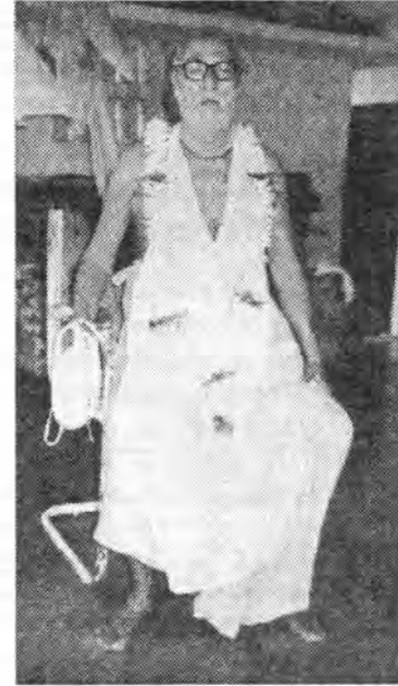
Diriamos que uno es casto debido a su propio progreso sincero y no debido a la adherencia a la figura, al concepto formal.

Vyaso vetti na vetti va. También allí hay una expresión tan potente, vyaso veti na vetti va. Todos los derechos reservados. La Conciencia de Krishna es ilimitada; no obstante, para nosotros hay la posibilidad de concebir su pureza en su forma libre